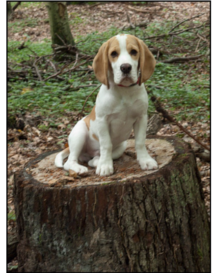
Nannuck of Stonehedge Mountain

Nach einem etwa 1½-stündigen Spaziergang durch den Auenwald werden wir im Hofgut Guntershausen einkehren und im ehemaligen Pferde-