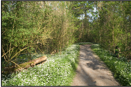
Auf dem Kühkopf

April im Hessischen Ried - nach einem langen und zähen Winter strebt die Natur nach einem Neuanfang. Im Auenwald auf dem Kühkopf sprießen die Frühblüher und nutzen das Licht, das noch ungehindert von einem dichten Blätterdach den Waldboden erreicht. Riesige Bärlauchbestände bilden Blüten aus, die in der zweiten Aprilhälfte weiße Blühtenteppiche zaubern. Die Hecken blühen und die Bäume treiben zarte Blätter. Ein Großteil der Zugvögel ist aus seinen Winterquartieren zurückgekehrt und ein vielstimmiges Konzert zeugt von eifriger Partnersuche.